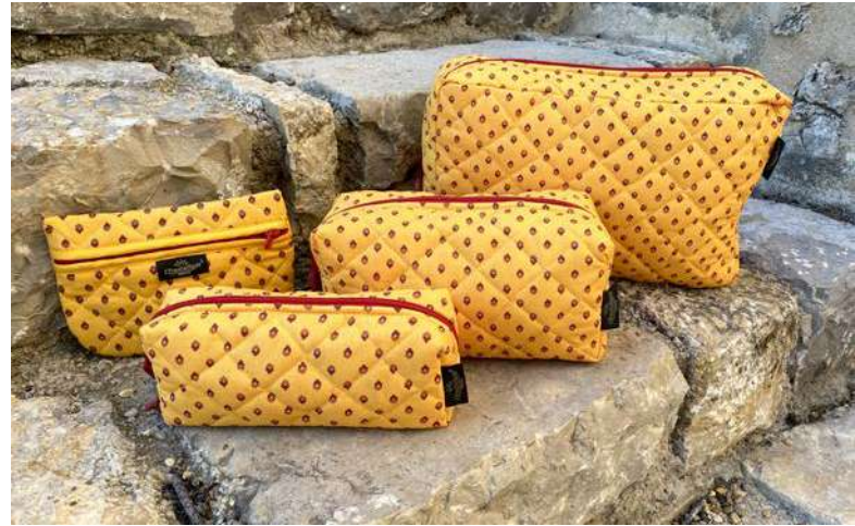
Fourre-tout petit, moyen et grand modèle, Pochette plate