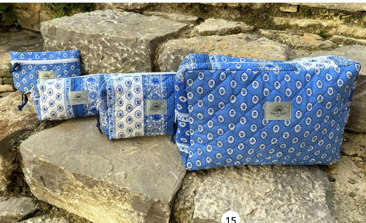
Fourre-tout petit, moyen et grand modèle, Pochette plate Bleu