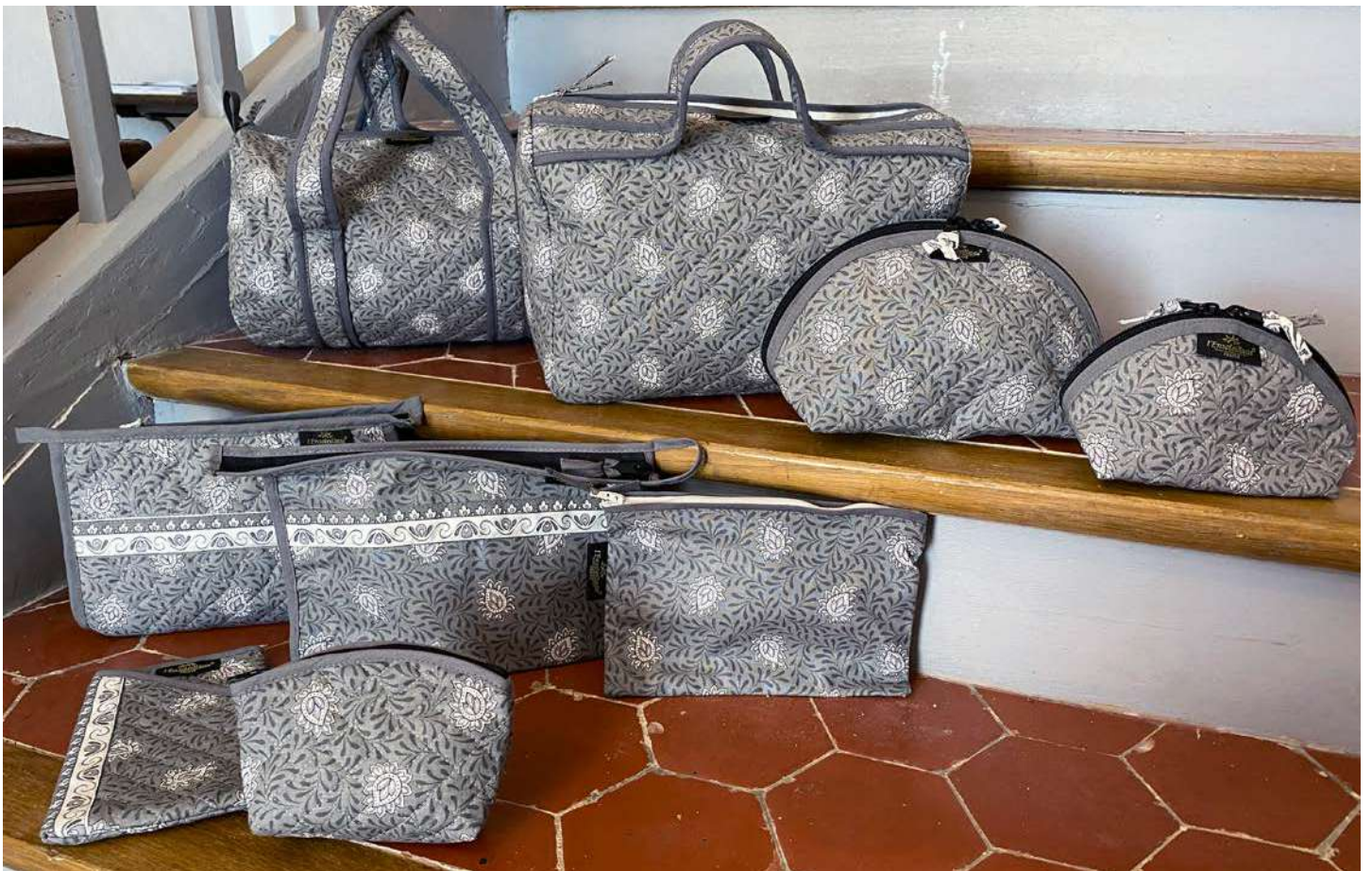
Sac polochon, Trousse maquillage petit et grand modèle, Trousse simple, Trousse simple enduite, Pochette enduite, Porte-monnaie, Étui à lunettes Gris