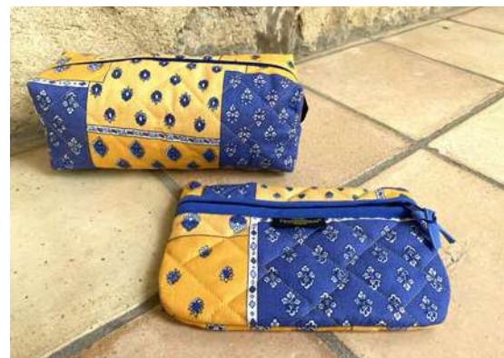
Fourre-tout petit modèle, Pochette plate Bleu/Jaune