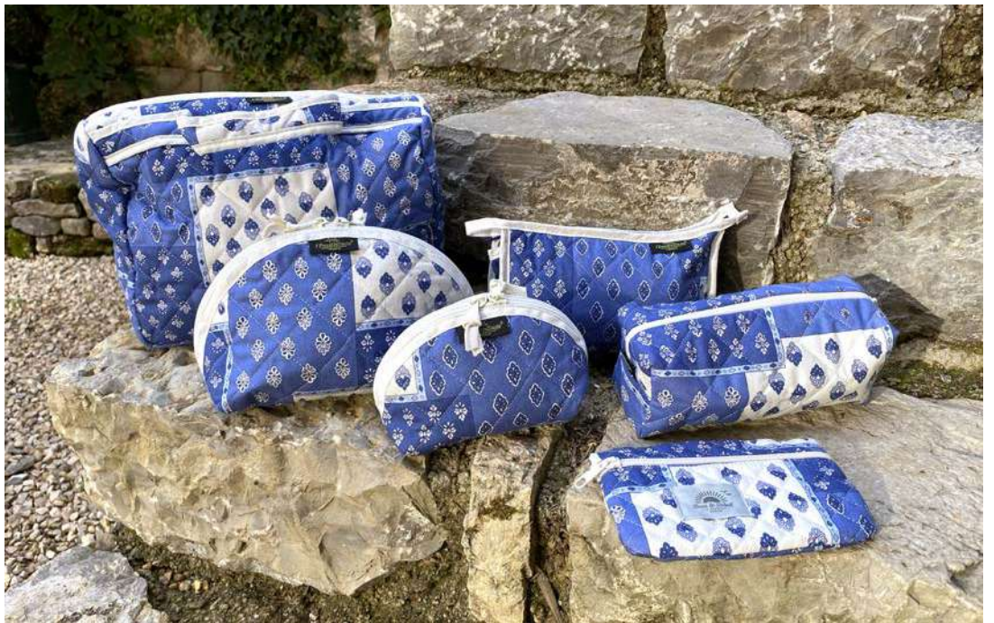
Vanity, Trousse maquillage petit et grand modèle, Trousse simple, Fourre-tout petit modèle, Pochette plate Blanc/Bleu