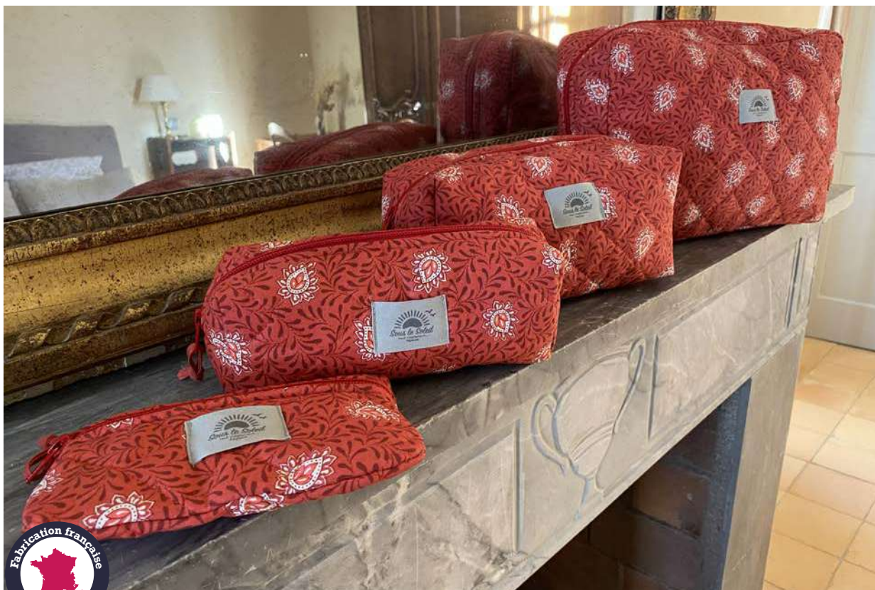
Fourre-tout petit, moyen et grand modèle, Pochette plate Rouge