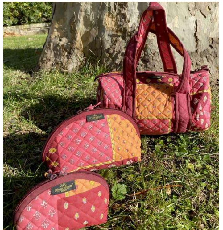
Sac polochon, Trousse maquillage petit et grand modèle Orange/Rose