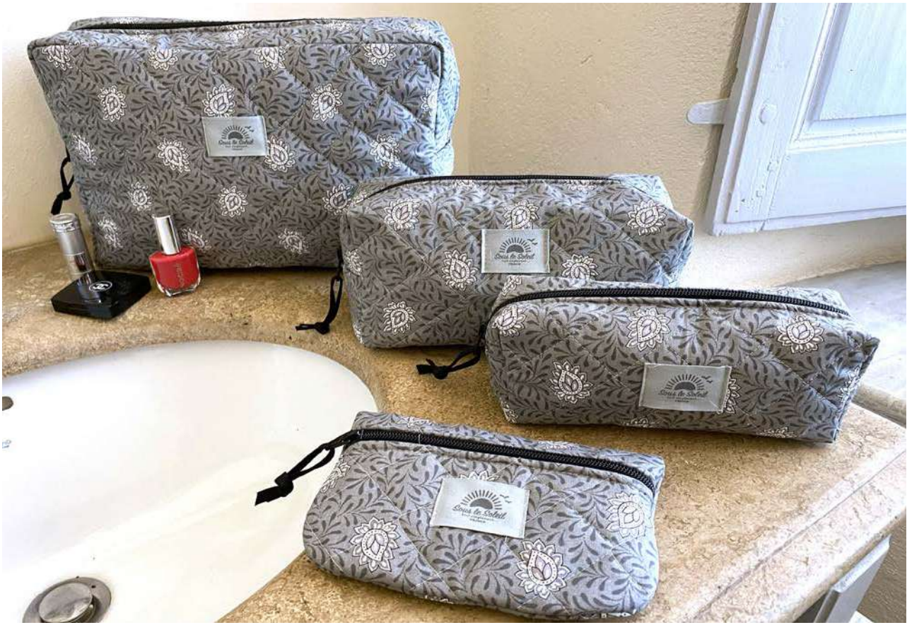
Fourre-tout petit, moyen et grand modèle, Pochette plate Gris