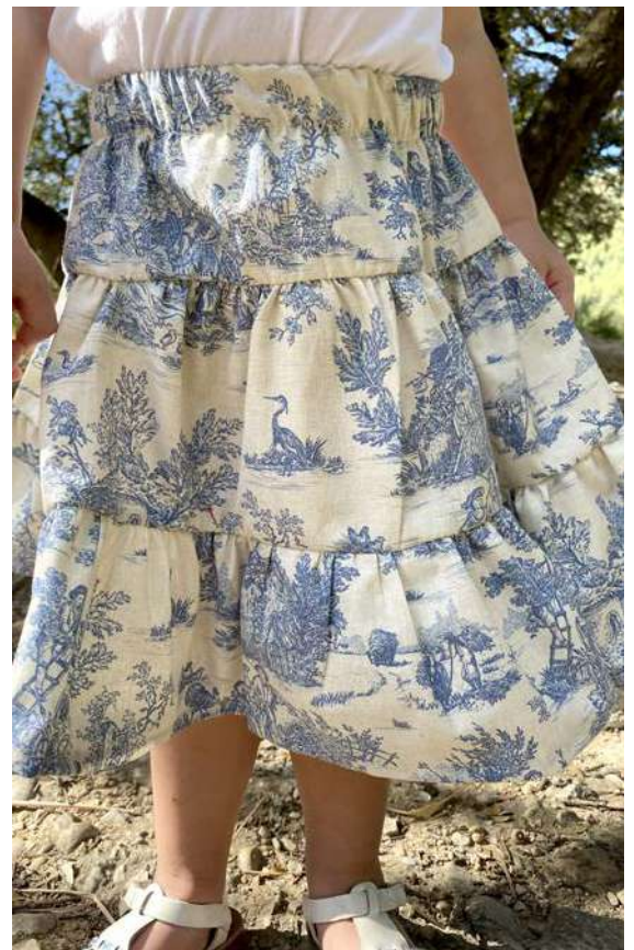
Mini pastorale Lin/Bleu