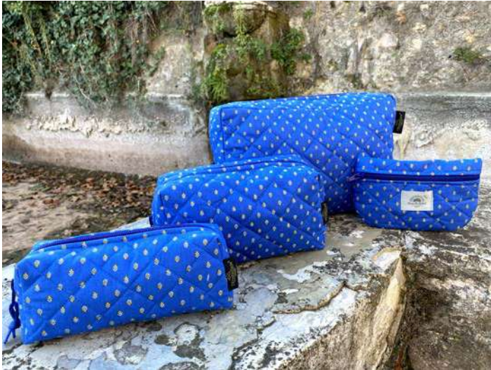
Fourre-tout petit, moyen et grand modèle, Pochette plate Bleu/Jaune

Ligne de bagagerie matelassée 100% COTON Bleu/Jaune, Bois de rose, Écru/Ciel, Safran