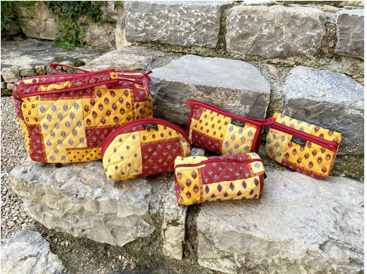
Vanity, Trousse maquillage petit et grand modèle, Trousse simple, Fourre-tout petit modèle, Pochette plate Jaune/Rouge