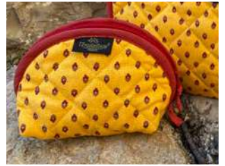
Trousse maquillage petit modèle Safran