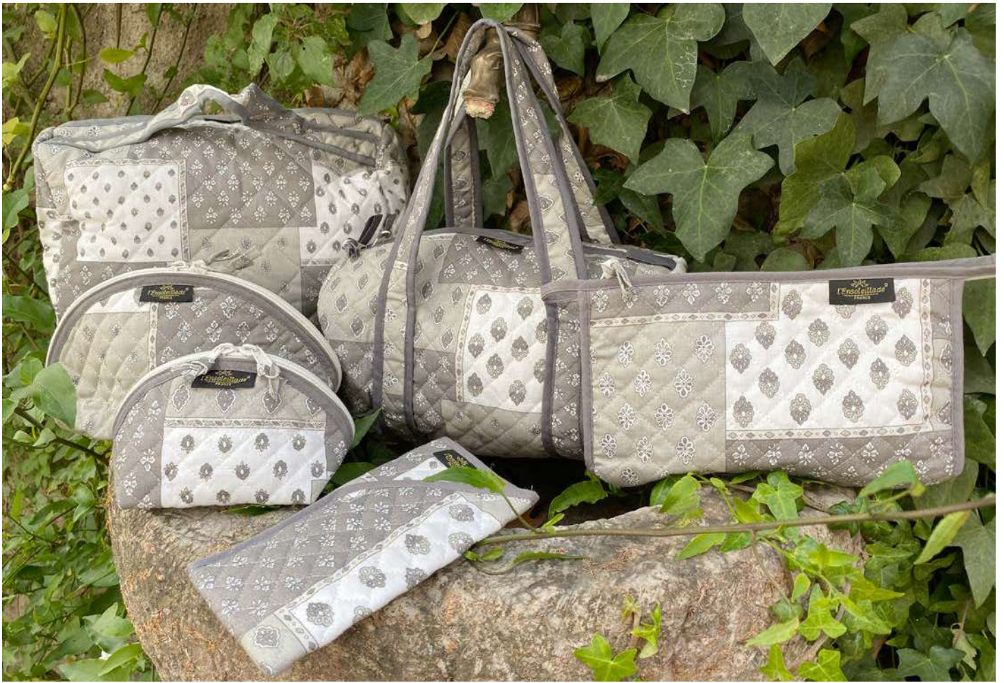
Sac polochon, Vanity, Trousse maquillage petit et grand modèle, Trousse simple , Étui à lunettes Mastic