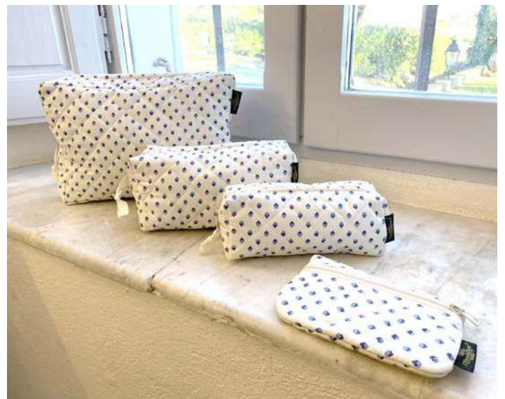
Fourre-tout petit, moyen et grand modèle, Pochette plate Écru/Ciel