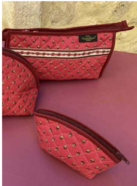
Porte Monnaie, Trousse simple Bois de rose