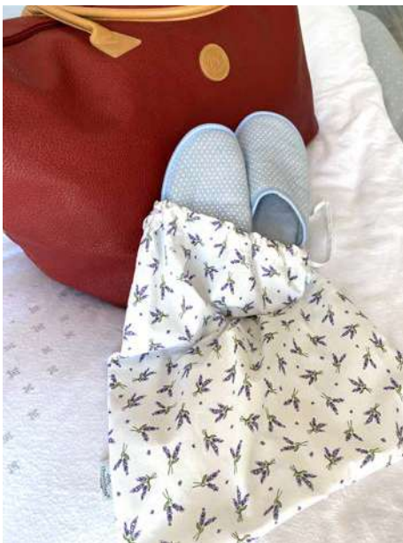
Sac à chaussures

Cabas, Fourre-tout petit, moyen et grand modèle, Pochette plate