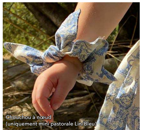
Chouchou à nœud (uniquement mini pastorale Lin/Bleu)