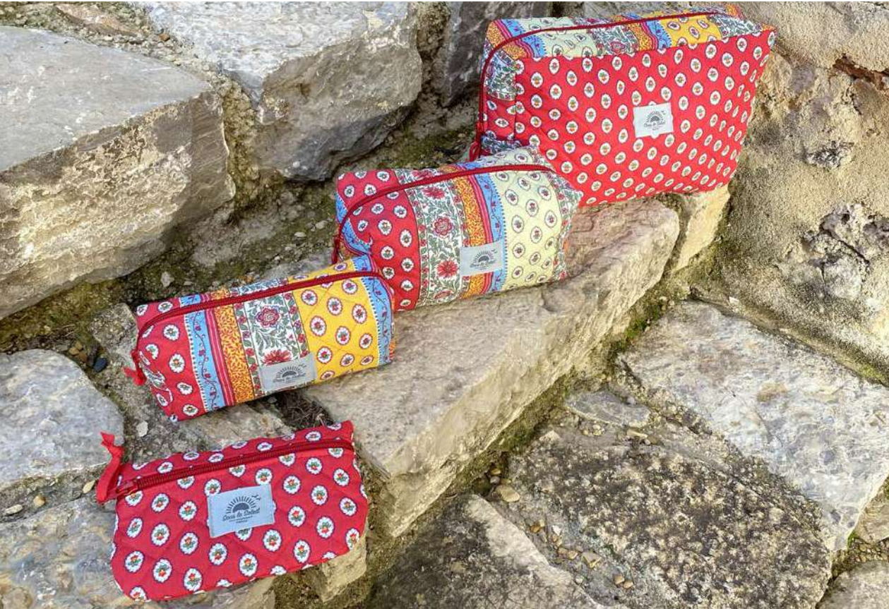
Fourre-tout petit, moyen et grand modèle, Pochette plate Multico

Ligne de bagagerie matelassée 100% COTON Bleu et Multico