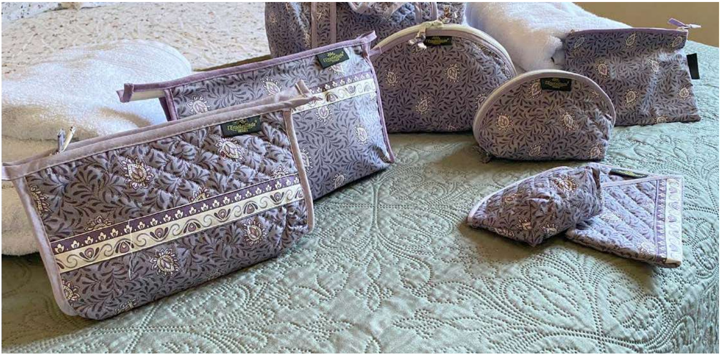
Trousse simple, Trousse simple enduite, Trousse maquillage petit et grand modèle, Pochette enduite, Porte-monnaie, Étui à lunettes Lavande