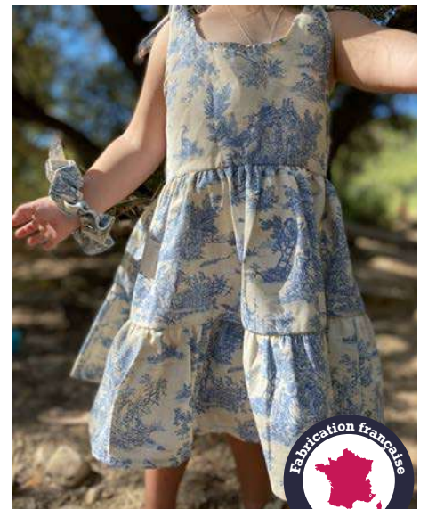
Mini Pastorale Lin/Bleu