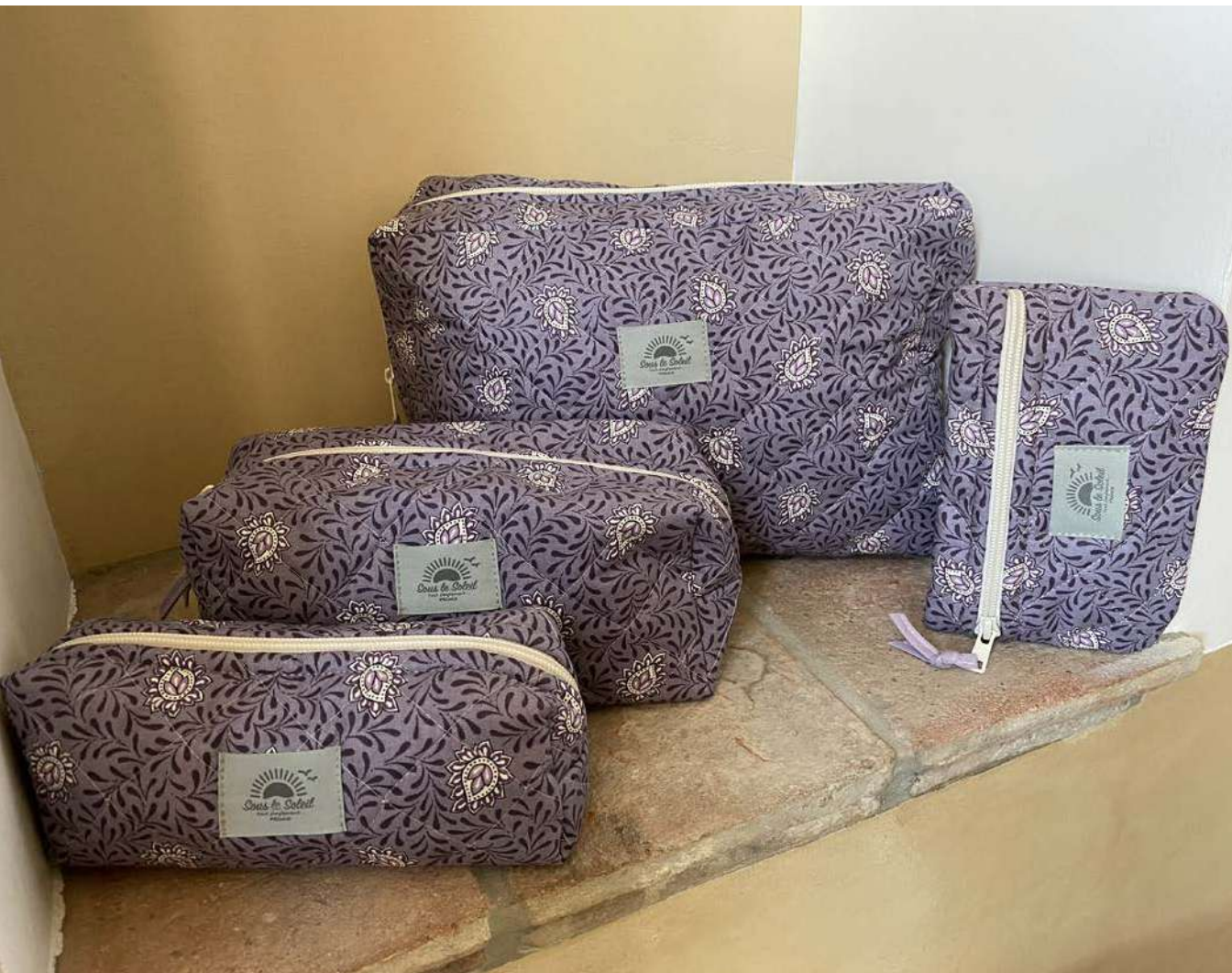
Fourre-tout petit, moyen et grand modèle, Pochette plate Lavande