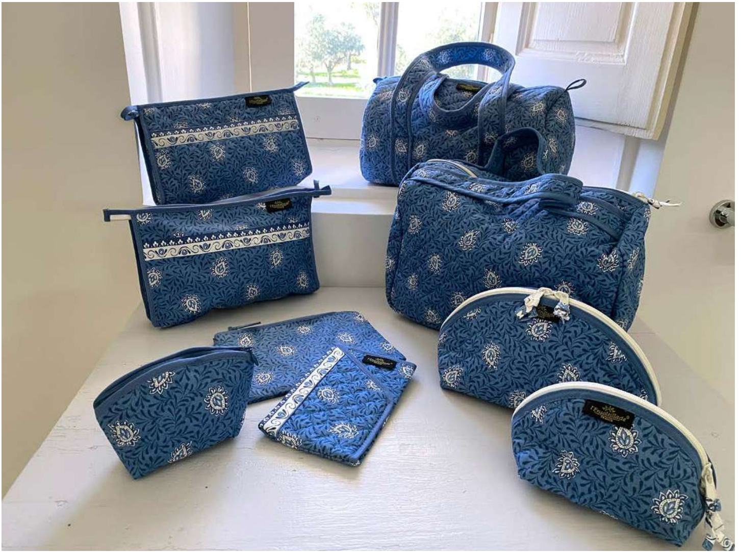
Trousse maquillage petit et grand modèle, Trousse simple, Trousse simple enduite, Pochette enduite, Porte-monnaie, Étui à lunettes Bleu