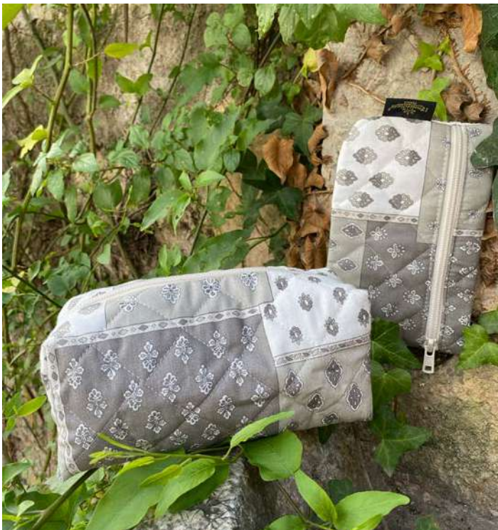
Pochette plate, Fourre-tout petit modèle Mastic