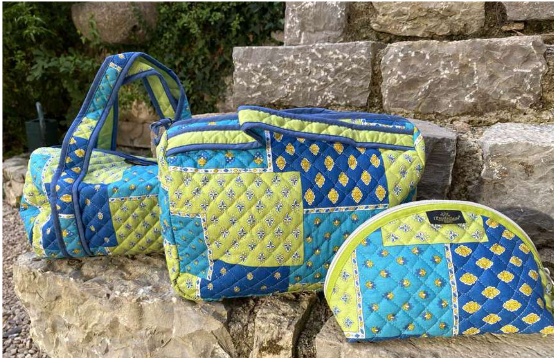
Sac polochon, Vanity, Trousse maquillage grand modèle Bleu/Anis