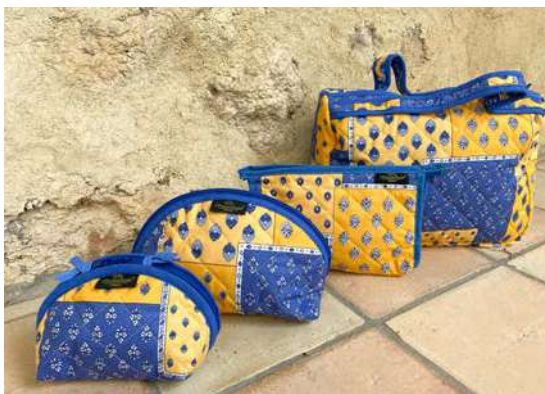
Trousse maquillage petit et grand modèle Trousse simple, Vanity Bleu/Jaune