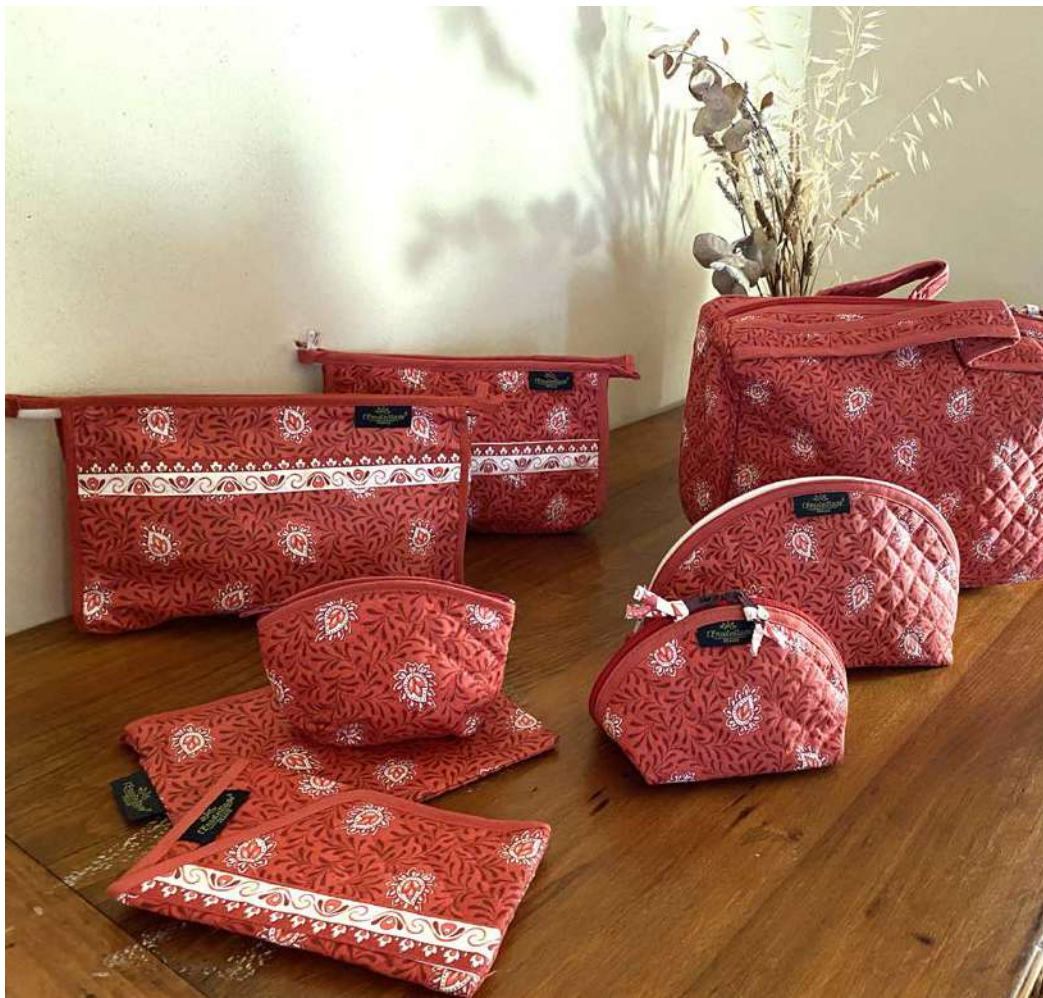
Trousse maquillage petit et grand modèle, Trousse simple enduite, Pochette enduite, Porte-monnaie, Étui à lunettes Rouge