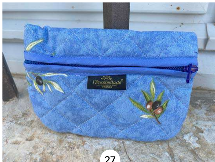
Pochette plate Bleu