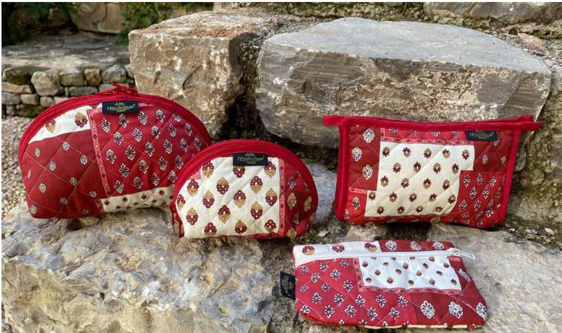
Trousse maquillage petit et grand modèle, Trousse simple, Pochette plate Écru/ Bordeaux