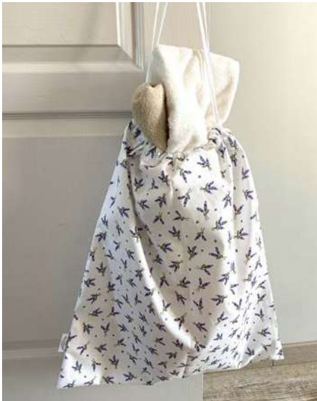
Sac à linge

Ligne de bagagerie matelassée 100% COTON Écru